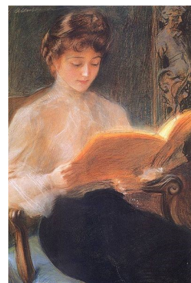
Teodor Axentowicz (1859–1938) alkotása