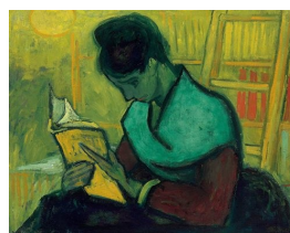
Van Gogh, A regényt olvasó

Olvasni gondolkodás nélkül zavarossá tehet, gondolkodni olvasás nélkül tévútra vezethet. (Szent Bernát)